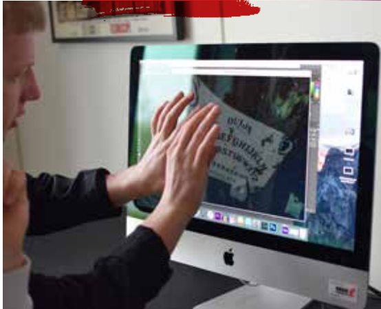
Medie og informatik