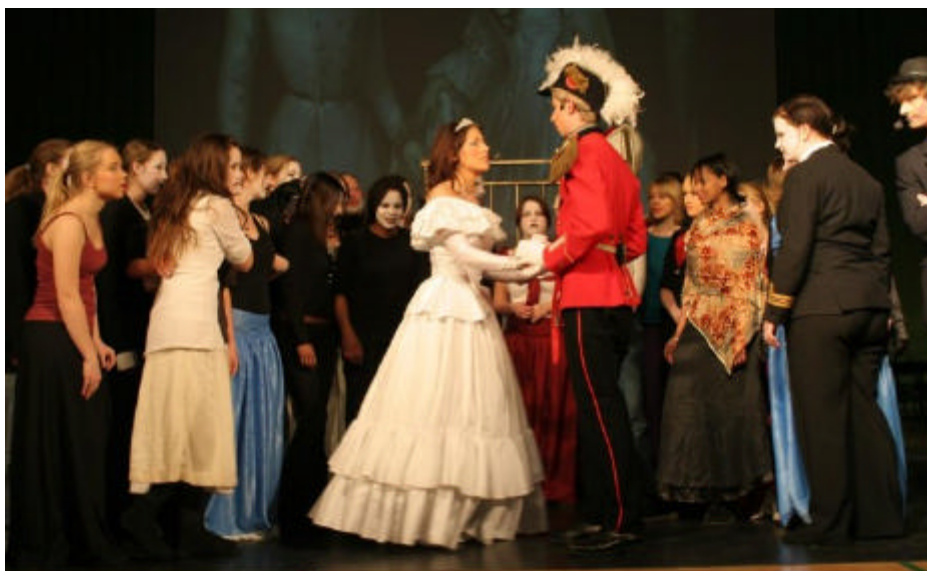
Fra musicalen "Elisabeth" februar 2005.

Fritidsaktiviteter tilbyder skolen i stort omfang: musical (næste gang foråret 2007), fritidssport, billedkunst, drama og musik.